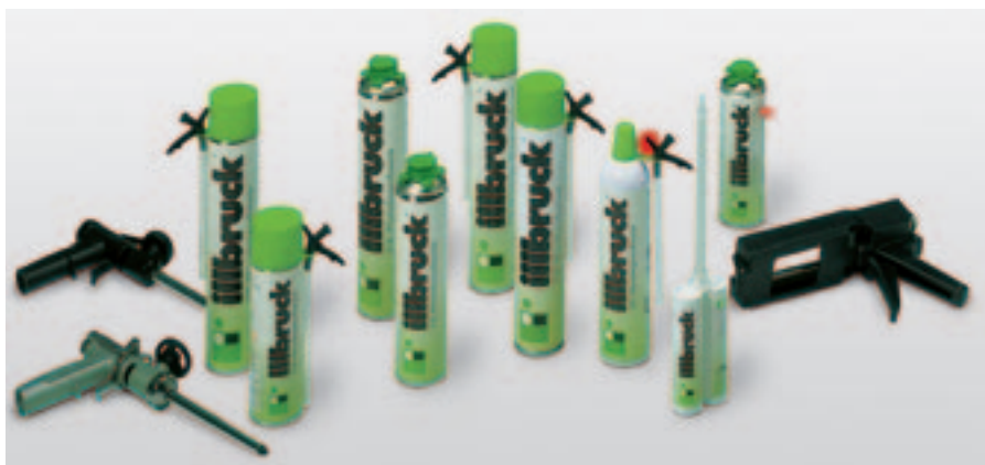
illbruck sortiment PU pěn

Výše uvedené údaje jsou jen všeobecným návodem. Díky výskytu dalších vlivů vznikajících z odlišností materiálů, podmínek při zpracování a upotřebení pásy se doporučuje provést před aplikací zkoušky, které ověří způsobilost materiálu pro příslušné užití.