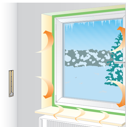
Optimální tepelná izolace