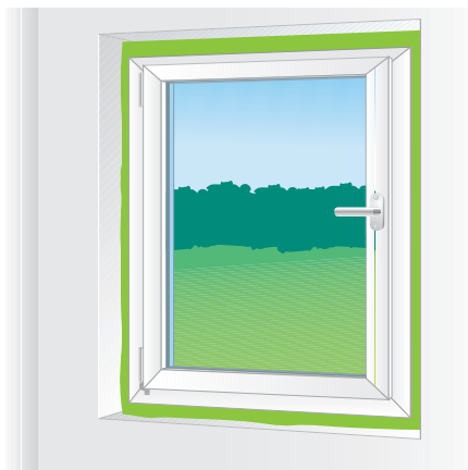
Pro instalaci otvorových výplní

Pěnu užívat jen v dobře větratelných místnostech. Při aplikaci nekouřit! Uchovávejte mimo dosah dětí. Při zasažení očí vyplachujte otevřené oči po dobu několika minut pod tekoucí vodou. Pokud příznaky přetrvávají konzultujte je s lékařem. Před aplikací je vhodné zakrýt přilehlé plochy. Nevytvrzená pěna lze po skončení aplikace vyčistit přípravkem PUR čističem nebo acetonem. Vytvrzenou pěnu je možno odstranit pouze mechanicky. Při styku s kůží ihned důkladně umyjte vodou a mýdlem. Nádobu je pod stálým tlakem. Chrňte ji před slunečním světlem, zdroji tepla a teplotou nad 50 °C. Při transportu dóz s pěnou vozem mohou být ukládány pouze do kufru nebo úložného prostoru. V žádném případě nepřpravovat dózy v kabině řidiče nebo zadním sedadle. Skladovat ve svislé poloze. Vytvrzená pěna není UV odolná. Další informace viz. bezpečnostní list.