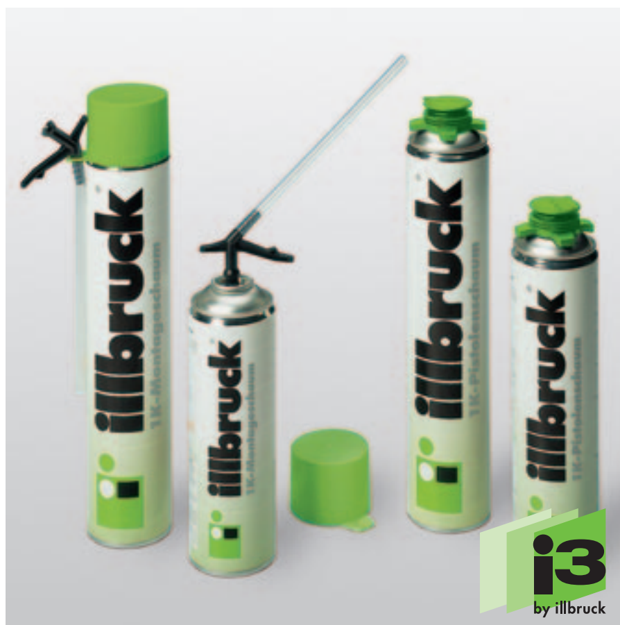
illbruck 1-komponentní pěna