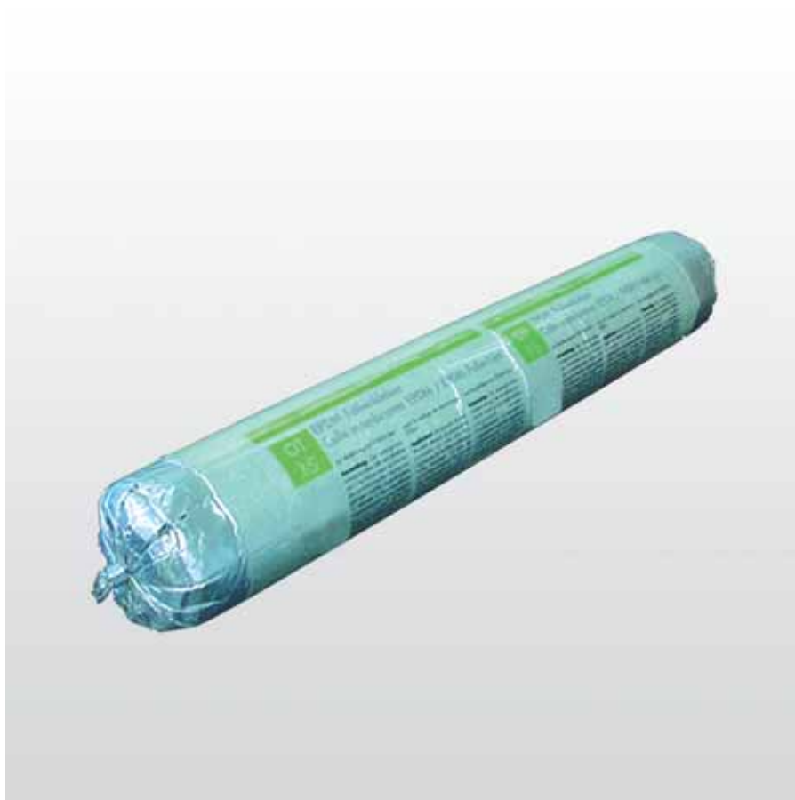
illbruck OT 15 lepidlo na fólie